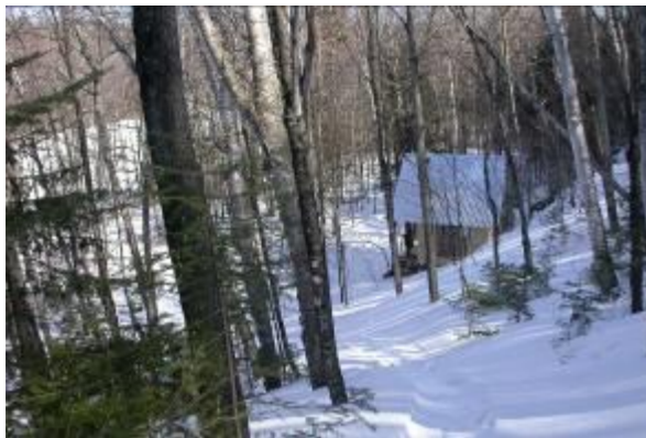
Refuge en bordure du lac de la Haute-ville

La piste de ski de fond a été inaugurée en décembre 2004. D'une longueur de 10 km, elle traverse différents peuplements forestiers qui caractérisent le piedmont appalachien, soient des cédrières, des érablières, et des sapinières. Elle est composée de 7 boucles dont les niveaux de difficulté varient de facile à intermédiaire. L'amateur de ski de fond y trouvera un dénivelé très intéressant avec de belles descentes sécuritaires. Cette piste est accessible par le rang de la Haute-Ville ou par la route Gaspard (carte ci-jointe), pour ceux qui veulent éviter la montée de la piste no 2. Les pistes sont tracées mécaniquement sauf la 4 qui est quand même accessible pour le ski. Il est interdit de marcher ou de faire de la raquette dans les pistes de ski et les chiens n'y sont pas admis.