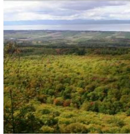
Panorama visible du sentier pédestre

Trois sentiers de randonnée pédestre et de raquettes totalisant 12 km ont été aménagés en 2006 au sud de la piste de ski de fond. Ils sont accessibles par le rang du Bonnet. Ces sentiers offrent des points de vue magnifiques sur le fleuve et la plaine du Saint-Laurent. Ces sentiers sont accessibles en toute saison et les chiens tenus en laisse sont admis.