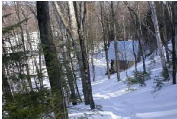
Refuge en bordure du lac de la Haute-ville

La piste de ski de fond, d'une longueur de 10 km, traverse différents peuplements forestiers qui caractérisent le piedmont appalachien, soient des cédrières, des érablières, et des sapinières. Elle est composée de 6 boucles dont les niveaux de difficulté varient de facile à intermédiaire. L'amateur de ski de fond y trouvera un dénivelé très intéressant avec de belles descentes sécuritaires. Cette piste est accessible par le rang de la Haute-Ville ou par la route Gaspard. (fig. 1), pour ceux qui veulent éviter la montée exigeante de la piste no 2.