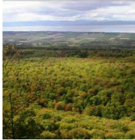
Panorama visible du sentier pédestre

Trois sentiers de randonnée pédestre et de raquettes totalisant 12 km ont été aménagés en 2006 au sud de la piste de ski de fond. Ils sont accessibles par le rang du Bonnet. Ces sentiers offrent des points de vue magnifiques sur le fleuve et la plaine du Saint-Laurent. Ces sentiers mettent en valeur le potentiel de produits forestiers non ligneux issus de différents arbres et arbustes. De plus, des essais d'implantation de champignons en milieu naturel y sont effectués.